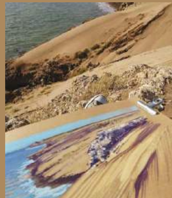
Gouache sur le motif, je travaille pour mon livre. Au loin se trouve le phare de Ras Bir, un des « personnages » du dernier chapitre!