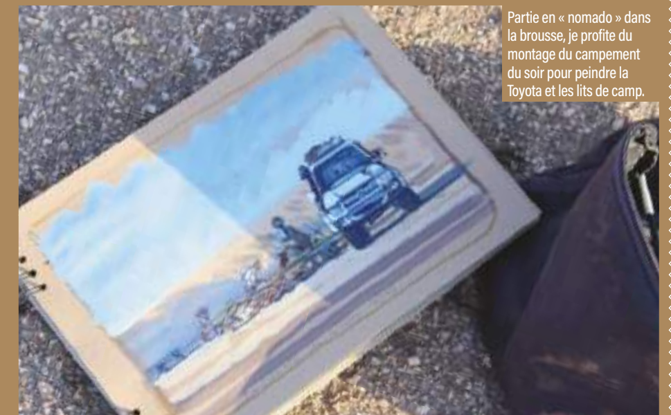
Partie en « nomado » dans la brousse, je profite du montage du campement du soir pour peindre la Toyota et les lits de camp.