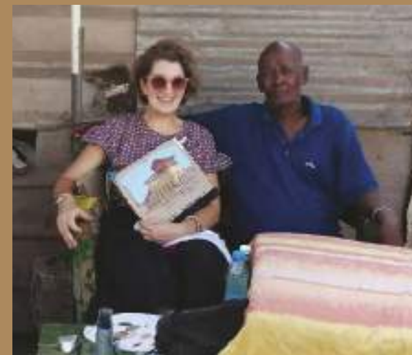
Matinée de peinture sur le motif, avenue 13 à Djibouti, où j'avais « squatté » la table d'une vendeuse de khat. Le commerce commençant à 11 heures, mon temps de travail était minuscule!